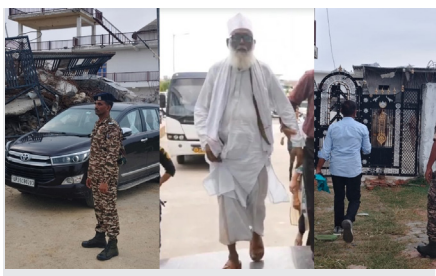
छांगुर बाबा के मुंबई सहित देशभर के 14 ठिकानों पर छापेमारी सुबह 5 बजे बलरामपुर और मुंबई पहुंची टीमें