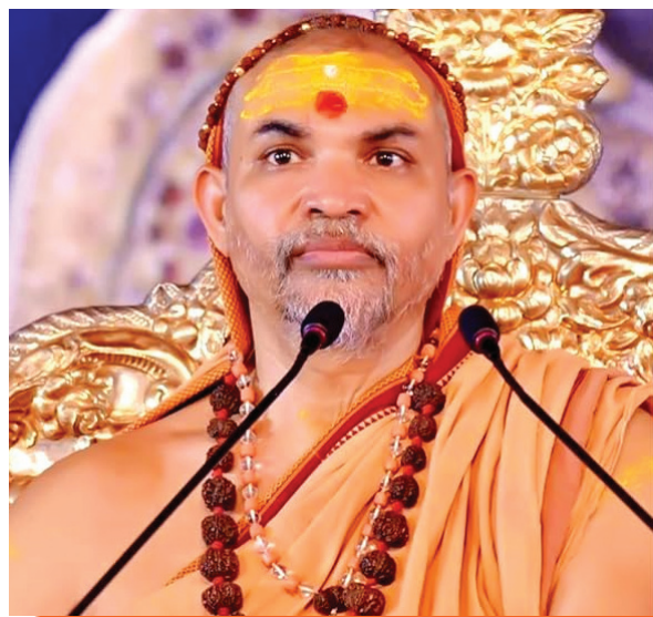
उत्तरामनाथ ज्योतिष्पीठाधीश्वर शंकराचार्य अविमुक्तेश्वरानंद सरस्वती

एक समय की बात है। कैलाश पर्वत पर भगवान शिव और माता पार्वती विराजमान थे। उनके सामुख