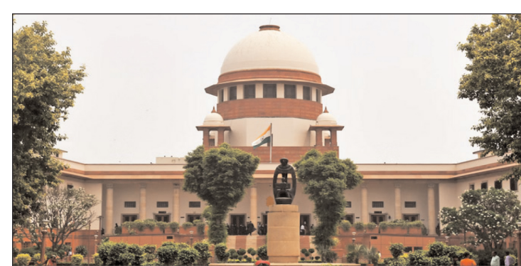
पिछले करीब 50 वर्षों से वकालत कर रहे हैं और एसआईआर से पहले वैध मतदाता थे। नाम हटाए जाने के खिलाफ उन्होंने अपीलीय न्यायाधिकरण

विमान से उतार दिया, जो बाद में दूसरे विमान (वीटी-आईसीडी) से रवाना हो गए। जब 320 विमान पर बिजली गिरी, तो उसमें 141 यात्री और छह क्यू सदस्य सवार थे। इंडिगो के अनुसार, दो प्राइंड स्टाफ मामूली रूप से प्रभावित हुए और उन्हें इलाज के लिए अस्पताल ले जाया गया। हालांकि, अधिकारी ने बताया कि बाद में उनकी हालत सामान्य हो गई। कोलकाता और आसपास के जिलों में शुक्रवार सुबह से ही आंधी-तूफान और बारिश हो रही है, जिससे कई इलाकों में जलभराव हो गया है और यातायात बाधित हो गया है।