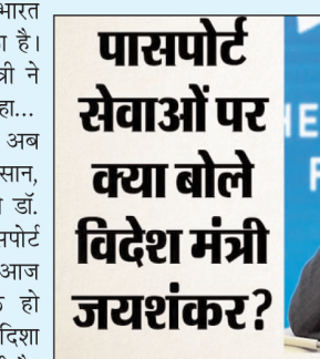
पेशेवरों की क्षमता को काफी सम्मान मिल रहा है। ऐसे में पासपोर्ट भारतीयों के लिए वैश्विक अवसरों का द्वार बनता जा रहा है। पासपोर्ट सेवा 2.0 को क्यों बताया गया महत्वपूर्ण? विदेश मंत्री ने कहा कि पासपोर्ट सेवा कार्यक्रम संस्करण 2.0 ने वैश्विक गतिशीलता को नई पहचान दी है। उनके अनुसार पासपोर्ट केवल एक

दस्तावेज नहीं है, बल्कि यह आर्थिक प्रगति, अंतरराष्ट्रीय व्यापार और राष्ट्रीय पहचान का एक महत्वपूर्ण साधन है। उन्होंने कहा कि सरकार की जिम्मेदारी है कि पासपोर्ट प्राप्त करना नागरिकों के लिए संघर्ष नहीं बल्कि उनका अधिकार बने। इसी सोच के तहत सेवाओं को और अधिक पारदर्शी तथा डिजिटल बनाया गया है। पासपोर्ट सेवा केंद्रों का नेटवर्क कितना बढ़ा? सम्मेलन में पेश किए गए आंकड़ों के अनुसार वर्ष 2014 में देश में केवल 77 पासपोर्ट सेवा केंद्र थे। अब इनकी संख्या बढ़कर 545 से अधिक हो गई है। इसके अलावा 454 पोस्ट ऑफिस पासपोर्ट सेवा केंद्र भी काम कर रहे हैं। इससे छोटे शहरों और दूरदराज के इलाकों के लोगों को भी पासपोर्ट सेवाओं का लाभ मिल रहा है। सरकार का दावा है कि इससे आवेदन प्रक्रिया तेज हुई है और नागरिकों को कम समय में पासपोर्ट उपलब्ध हो रहा है। भारतीय पासपोर्ट की वैश्विक पहचान कैसे मजबूत हुई? जयशंकर ने कहा कि भारत की विदेश नीति ने देश को विश्व बंधु के रूप में स्थापित किया है। इसका अंतर भारतीय पासपोर्ट की साख पर भी दिखाई देता है।