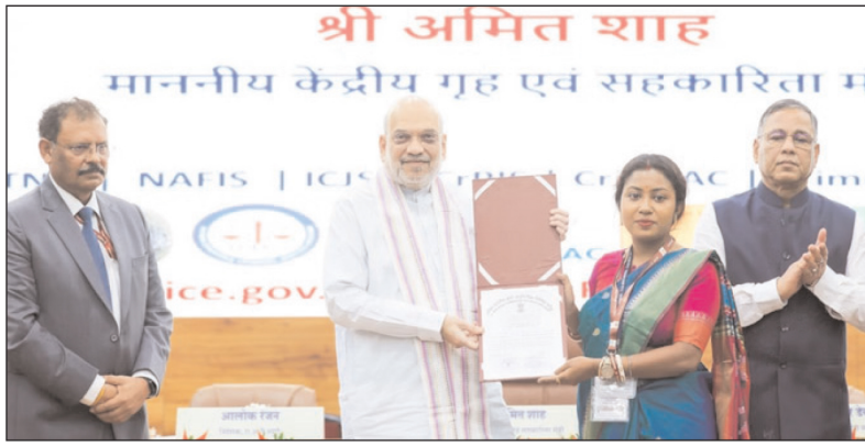
एनएफआईएस, सीआरपीआई, ई-प्रॉसिक्यूशन और ई-फॉरेंसिक्स सेंटर ने क्रिमिनल जस्टिस चेंज को टेकनॉलॉजी से जोड़ा है। अब डेटा को एक्शन योग्य इंटरलिंग्वेज में बदला जा रहा है। पारंपरिक फॉरेन्सिक-आधारित पुलिसिंग मॉडल से आगे बढ़कर साइबर-आधारित एक्टिविटीज आधारीत इन्वेस्टिगेशन को अपराध निर्यंत्रण का सबसे प्रभावी माध्यम बना रहा है एआई, मशीन लर्निंग और पैटर्न एनालिसिस के जरिए रिपीट ऑफेंडर्स और अंतरराज्यीय अपराध नेटवर्क को अपराध करने से पहले रोकने का नया प्रेमवर्क विकसित किया जा रहा है। एनसीआरबी और सीपीआरडी, ये दोनों संगठन केवल रिकार्ड रखने का काम नहीं करेंगे। ये संगठन इससे आगे बढ़कर इंटरलिंग्वेज-ड्रिवन क्राइम प्रिवेंशन संस्था में तबदील हो रहे हैं।

नई दिल्ली केन्द्रीय गृह एवं सहकारिता मंत्री अमित शाह ने शुक्रवार को नई दिल्ली में 26वें अखिल भारतीय फिंगरप्रिंट सम्मेलन 2026 का उद्घाटन करते हुए कहा, गृह मंत्रालय सुप्रीम कोर्ट और हाईकोर्ट के साथ मिलकर लंबित मामलों को कम करने का ब्लूप्रिंट तैयार कर रहा है। उन्होंने तीन ऐप लांच किए हैं। इनकी मदद से लंबित मामलों का शीघ्र निपटारा होगा। साथ ही ये ऐप समयबद्ध न्याय का माध्यम बनेंगे। एआई की मदद से 37 करोड़ ऑनलाइन रिकार्ड, अपराधियों को पकड़ने का दूल्हा एक महत्वपूर्ण दूल बनेगा। गृह मंत्री ने जो तीन ऐप लांच किए हैं, उनमें एनसीआरबी-अभिज्ञान सीआरपीआई, ई-प्रॉसिक्यूशन 2.0 और ई-फॉरेंसिक्स 2.0 ऐप्स शामिल हैं। ये ऐप, लंबित मामलों का जल्द निपटारा करने में मददगार साबित होंगे। एफआईआर से कनिक्शन तक तीन साल के भीतर न्याय सुनिश्चित करना, मोदी सरकार के मिनिमल जस्टिस रिफॉर्मस का प्रमुख उद्देश्य है। शाह ने कहा, अपराधी कितना भी चतुर हो, कानून और विज्ञान की संयुक्त शक्ति से नहीं बच सकता।