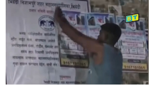
वालों के खिलाफ कानूनी कार्रवाई की जाएगी। आरोप है कि देर रात एक युवक ने उसी मनपा सूचना बोर्ड पर एक निजी डेवलपर का विज्ञापन पोस्टर चिपका दिया, जिससे मनपा की चेतावनी पूरी तरह ढंक गई। इतना ही नहीं, इस दौरान डेवलपर के प्रचार का गीत बजाते हुए वीडियो भी बनाया गया और उसे सोशल मीडिया पर प्रसारित कर दिया

जानकारी के अनुसार, शहर के इंदिरा गांधी मेमोरियल (आईजीएम) अस्पताल के प्रवेश द्वार के सामने स्थित फ्लाईओवर के खंभे पर मनपा द्वारा एक चेतावनी बोर्ड लगाया गया था। इस बोर्ड पर स्पष्ट रूप से लिखा गया था कि सार्वजनिक स्थानों, बिजली के खंभों, स्ट्रीट लाइट पोल और फ्लाईओवर के कॉलम पर बिना अनुमति बैनर, होर्डिंग और पोस्टर लगाया प्रतिबंधित है तथा ऐसा करने